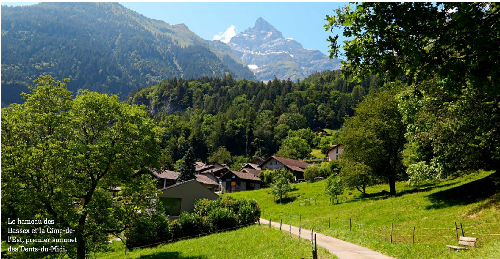
Le hameau des Bassex et la Cime-de-l'Est, premier sommet des Dents-du-Midi.