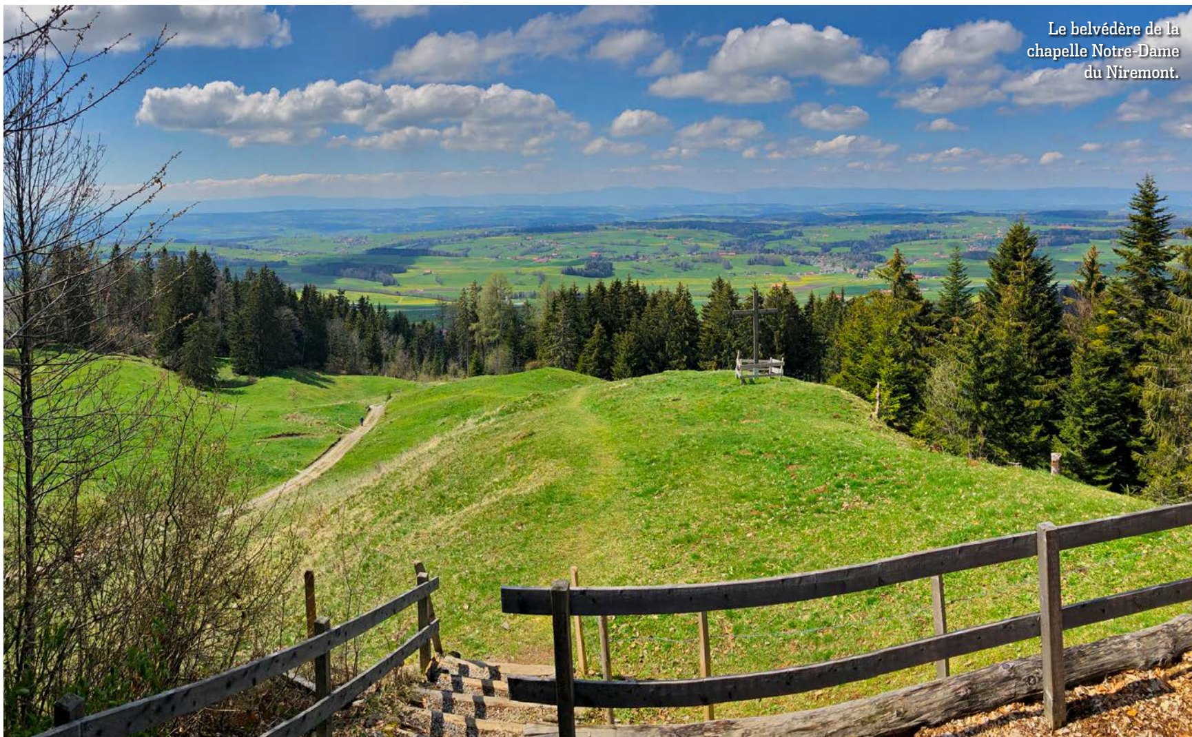
Le belvédère de la chapelle Notre-Dame du Niremont.