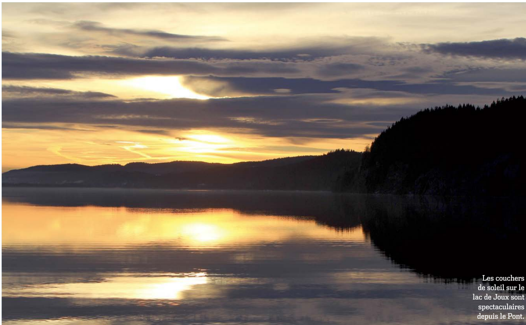
Les couchers de soleil sur le lac de Joux sont spectaculaires depuis le Pont.