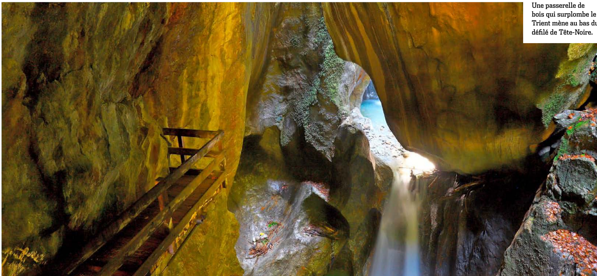
Une passerelle de bois qui surplombe le Trient mène au bas du défilé de Tête-Noire.

BALADE Peu après le village valaisan de Trient, sur la route de Chamonix, le lieu-dit Tête-Noire recèle des beautés naturelles au cœur d'un impressionnant défilé. Cascades et cathédrale naturelle sont à découvrir.