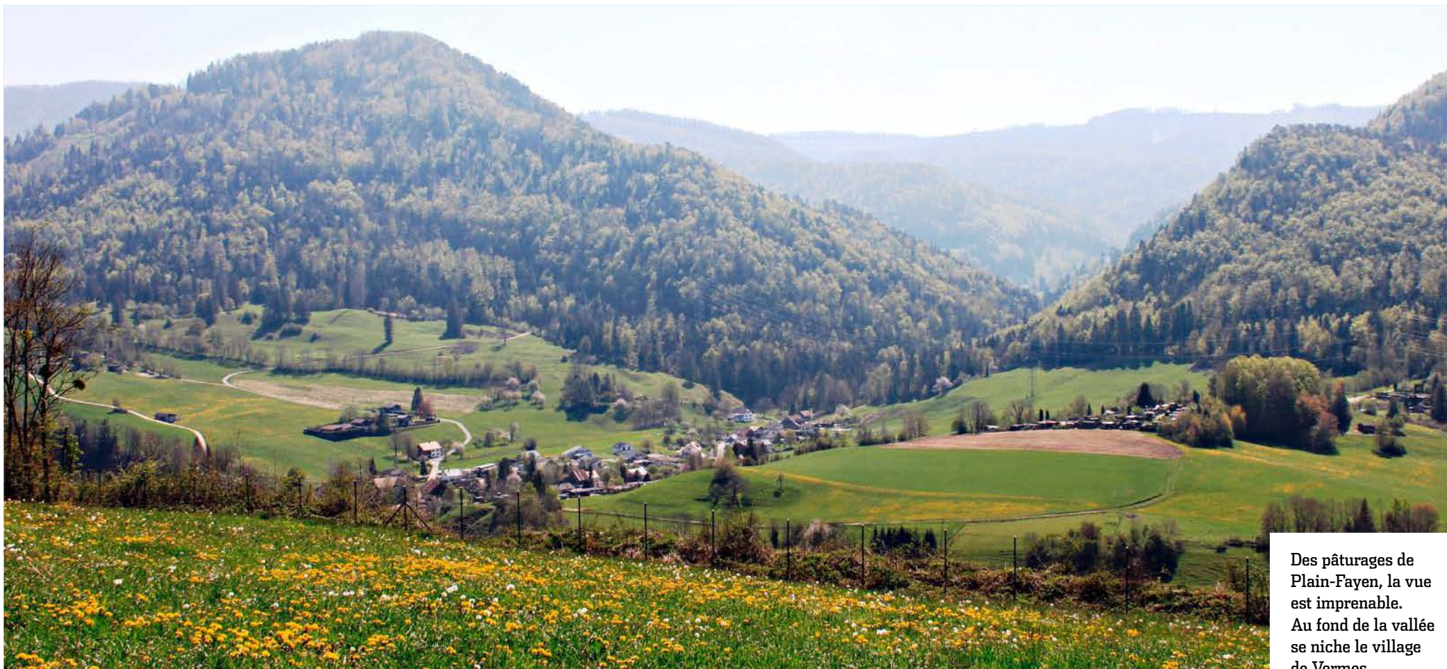
Des pâturages de Plain-Fayen, la vue est imprenable. Au fond de la vallée se niche le village de Vermes.

BALADE Voilà quarante ans qu'un sentier botanique met en valeur la nature préservée de Vermes (JU). Cet anniversaire, qui sera célébré ce dimanche, est l'occasion de découvrir les beautés de la région.