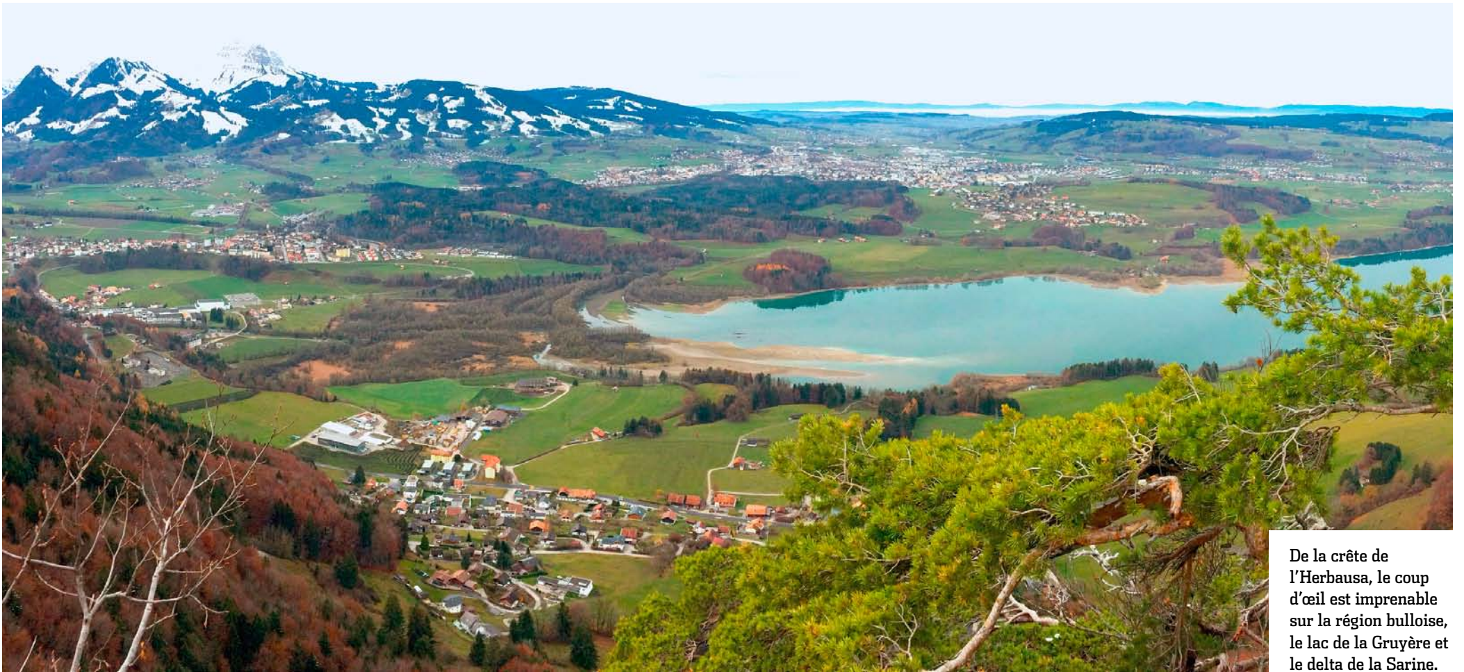
De la crête de l'Herbausa, le coup d'œil est imprenable sur la région bulloise, le lac de la Gruyère et le delta de la Sarine.

BALADE À l'entrée de la vallée de la Jogne qui conduit au col du Jaun, la commune de Châtel-sur-Montsalvens offre un remarquable éventail de paysages. De quoi s'en mettre plein les yeux.