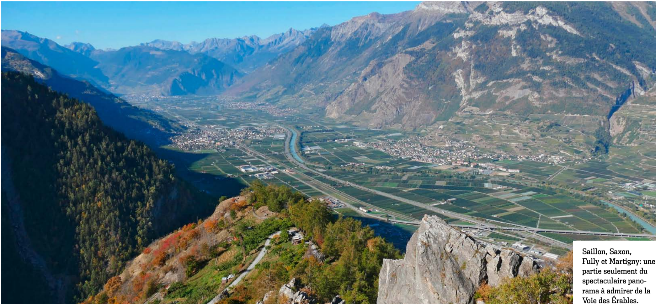
Saillon, Saxon, Fully et Martigny: une partie seulement du spectaculaire panorama à admirer de la Voie des Érables.

BALADE L'automne est sans conteste la saison idéale pour (re)découvrir le village d'Iséables, perché au-dessus de la plaine du Rhône, et son sentier thématique de charme aux couleurs flamboyantes et au panorama unique.