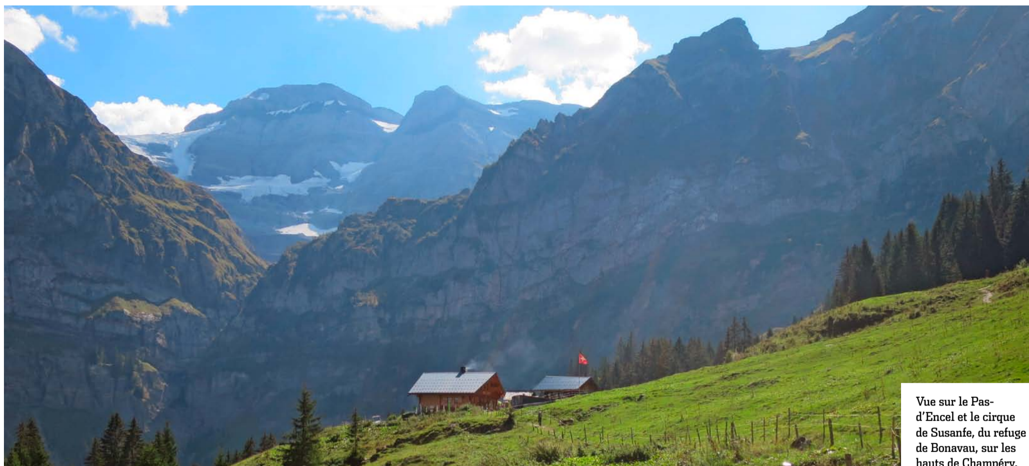
Vue sur le Pas-d'Encel et le cirque de Susanfe, du refuge de Bonnavau, sur les hauts de Champéry.

BALADE Nichée au fond du val d'Illiez, la Saufla répand son souffle glaciaire dans un vallon étroit. Une passerelle aérienne permet de longer une rive, puis l'autre, tout en appréciant le panorama sur le cirque de Bonnavau.