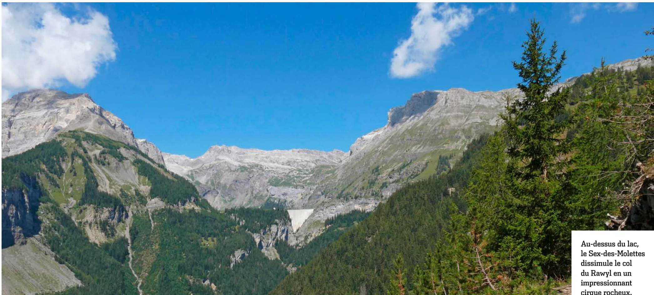
Au-dessus du lac, le Sex-des-Molettes dissimule le col du Rawyl en un impressionnant cirque rocheux.

BALADE Le sentier sinueux qui rejoint le lac de Tseuzier depuis Crans-Montana (VS) demande d'avoir le pied sûr et vaillant, mais réserve un panorama unique tout du long et de belles sensations aériennes sur la couronne du barrage.