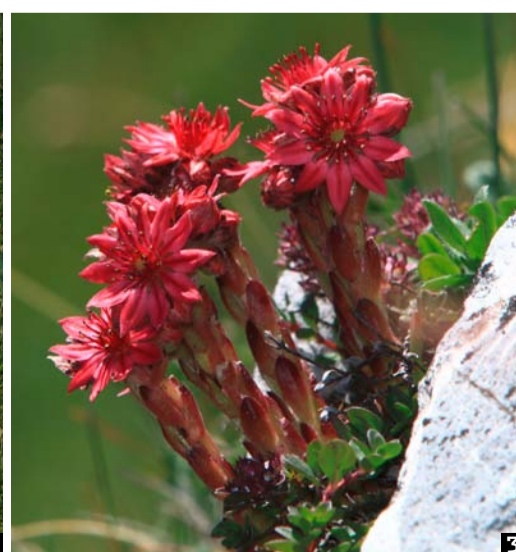
1. L'aster des Alpes est particulièrement abondant. Cette fleur attire de nombreux papillons, à l'exemple de cette turquoise. 2. Plusieurs livres permettent d'en apprendre autant sur la botanique que sur la faune ou l'histoire locales. 3. Fleur éclatante, la jubarbe des montagnes.