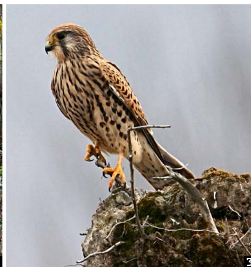
1. Les feuilles mortes qui recouvrent cette souche permettent d'identifier quelques essences comme le chêne, le hêtre et le frêne qui peuplent le Bois d'Yé. 2. En contrebas d'Engollon coule le Seyon, la principale rivière du Val-de-Ruz. 3. Ce faucon crécerelle est à l'affût.