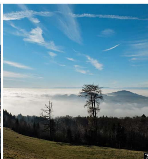
1. Le funiculaire relie Vevey au Mont-Pèlerin depuis 1900. Aujourd'hui, il est automatisé. 2. Dominant la Veveysse fribourgeoise, le Moléson salue le Mont-Pèlerin et attend la neige. 3. Le Mont-de-Gourze émerge dans le stratus recouvrant Puidoux, au pied du Mont-Cheseaux.