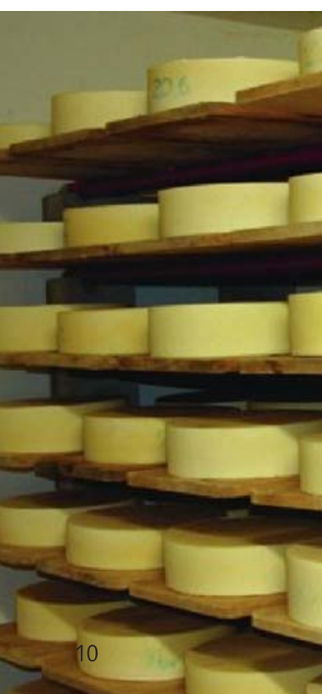
Tableau 1: Marketing

Il n'y a pas que la production qui requiert un grand savoir-faire: la phase de maturation du fromage en cave également.